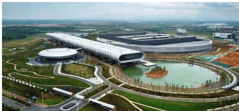
台積電南京廠

在這個共同聲明之外，台積電也承諾會投資1千5百萬美元，培訓興建半導體廠所需的人力。其實明眼人一看就知道，這1千5