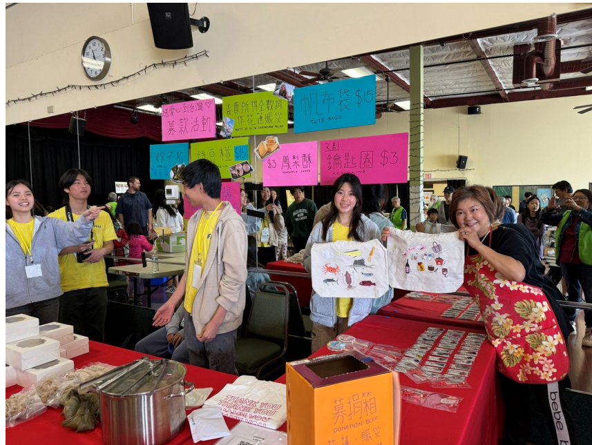
5/11/2024 聖地牙哥台灣同鄉會園遊會