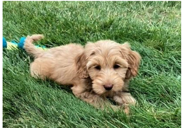
Luciana's new puppy, CiCi — she is an Australian labradoodle