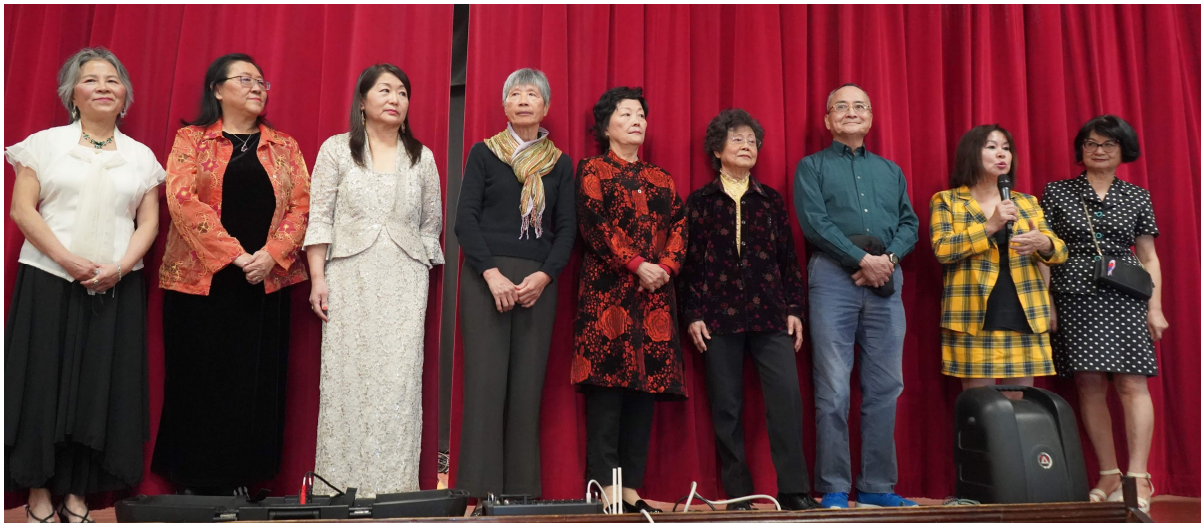
2/1/2020 台灣同鄉會年會暨新春午會