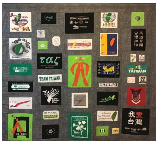
Quilt of T-Shirts Made by T. A. Organizations