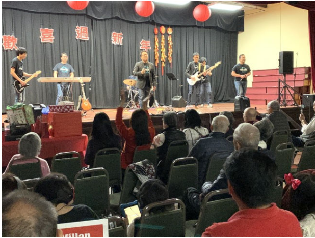
Stem Cell 西洋樂團由新生代華裔組成，皆是科技界菁英。