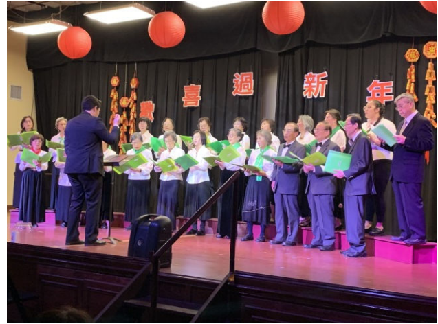
長輩合唱團獻唱 Do Re Mi，歌聲優美動聽。