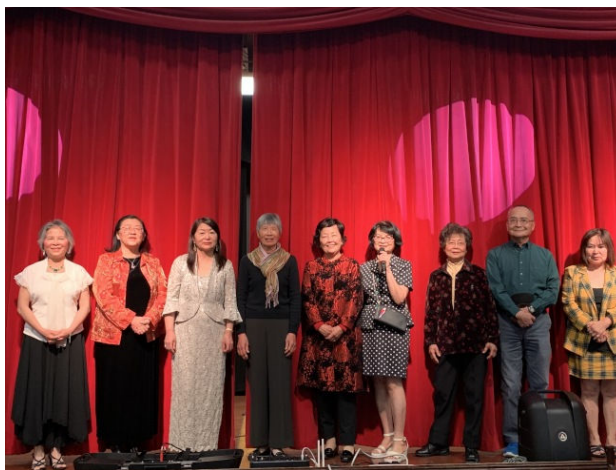
聖地牙哥台灣同鄉會新舊理事合影。