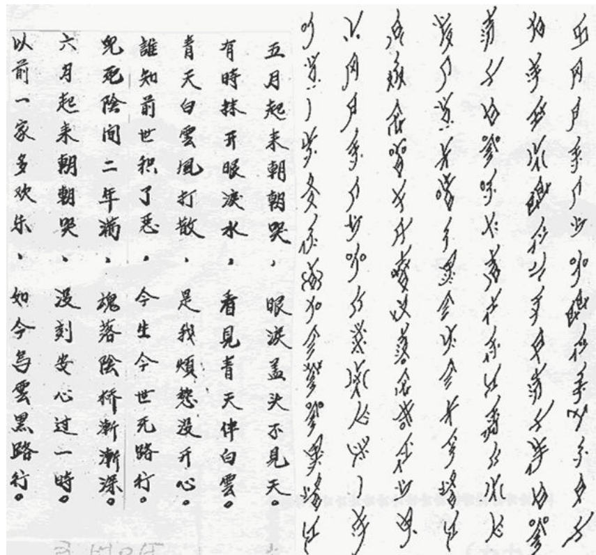
女書的樣本及其中文翻譯

麗莎女士的作品多以華人的故事為主。在美國我們可以讀到各個種族的書籍，也非常樂見在有關華人故事及文化方面有深度的著作，在此我由衷的感謝麗莎女士努力，希望她能繼續的寫下去。