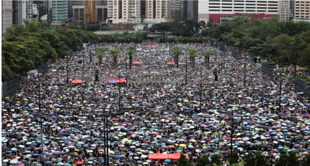
香港「反送中」抗議活動，星期日（8月18日）在銅鑼灣維多利亞公園參與集會，要求香港政府撤回《逃犯條例》修訂及成立獨立委員會調查警民衝突。

錄片。那些南極企鵝們在攝氏零下 40 度、風速每小時 100 公里的惡劣環境下，牠們背對背、肩併肩、翼靠翼，擠滿成一個圓形，相互取暖，而且站在內圍的都會主動和站在外圍的交換位置。雖然牠們不能改變周邊環境的挑戰，但是牠們可以共同面對這個生死關頭。現在的香港人就好像那些一隻隻無助的企鵝，在共同面對那四面八方悽寒撲面的風雨。讓我們祝福和支持這群和我們同病相憐的香港人。香港加油！台灣加油！天佑香港！天佑台灣！