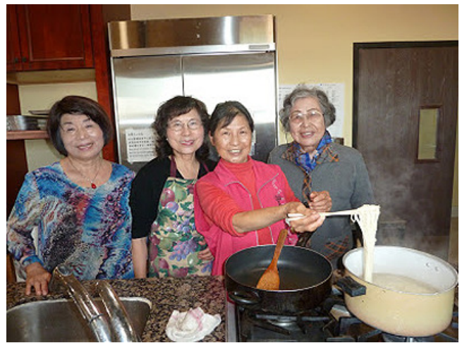
2016-12-10 生活座談 稅務 & 財務