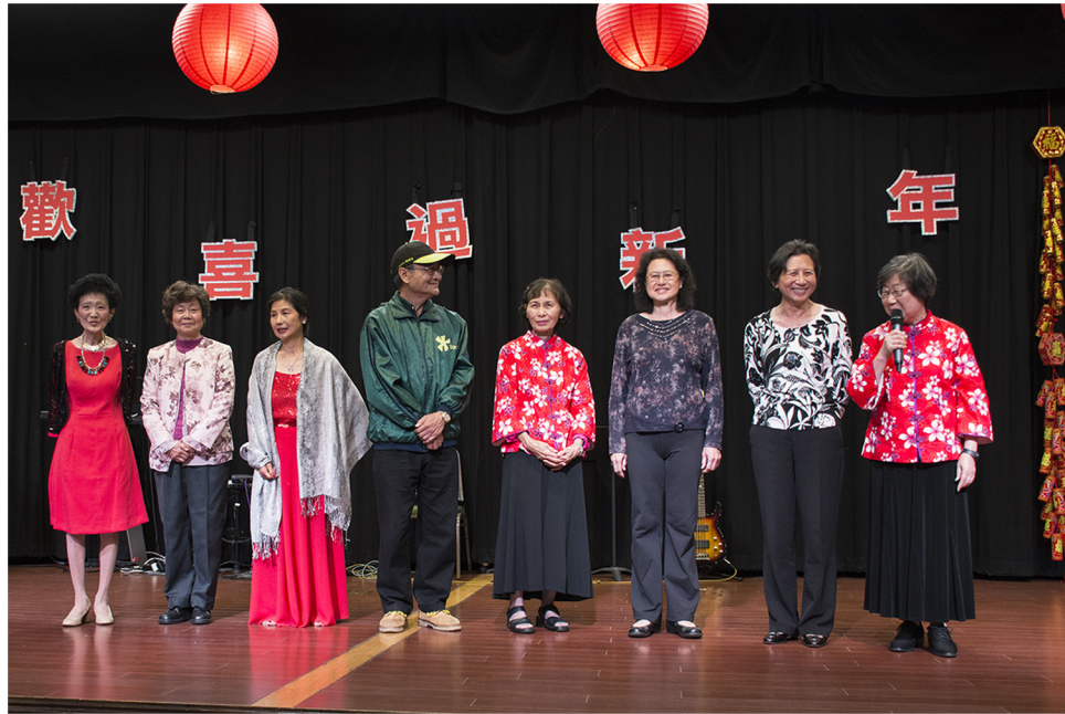
2017 年新任同鄉會理事團隊