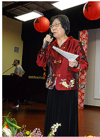
聖地牙哥台灣同鄉會會長