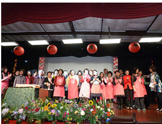
感謝晚會全體義工