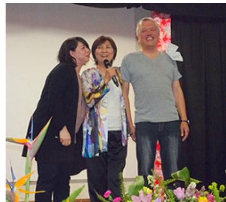
感謝 Employee of the Year