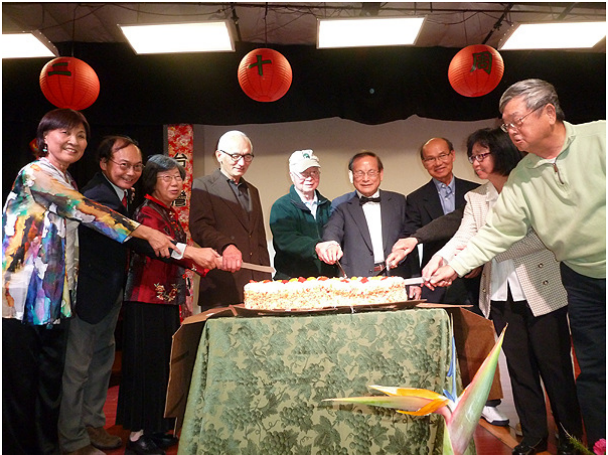
2/25/2017 台美基金會二十週年募款餐會，歷任董事長和台灣中心主任一起切蛋糕