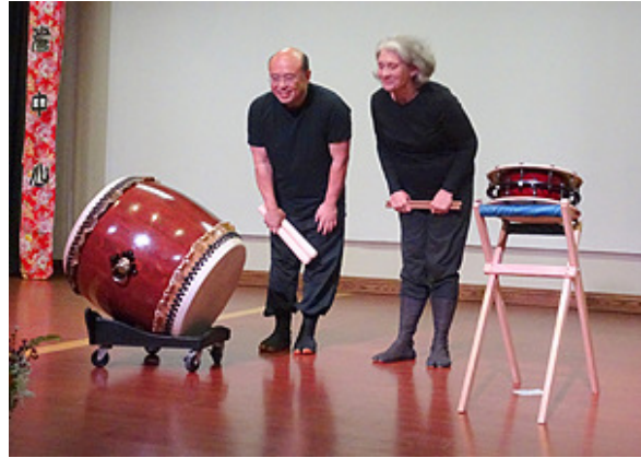
TACC Ohana Taiko