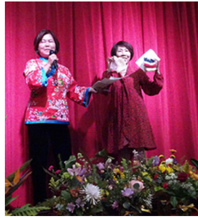
Knitting Baby Bonnet for Hospital New Borns