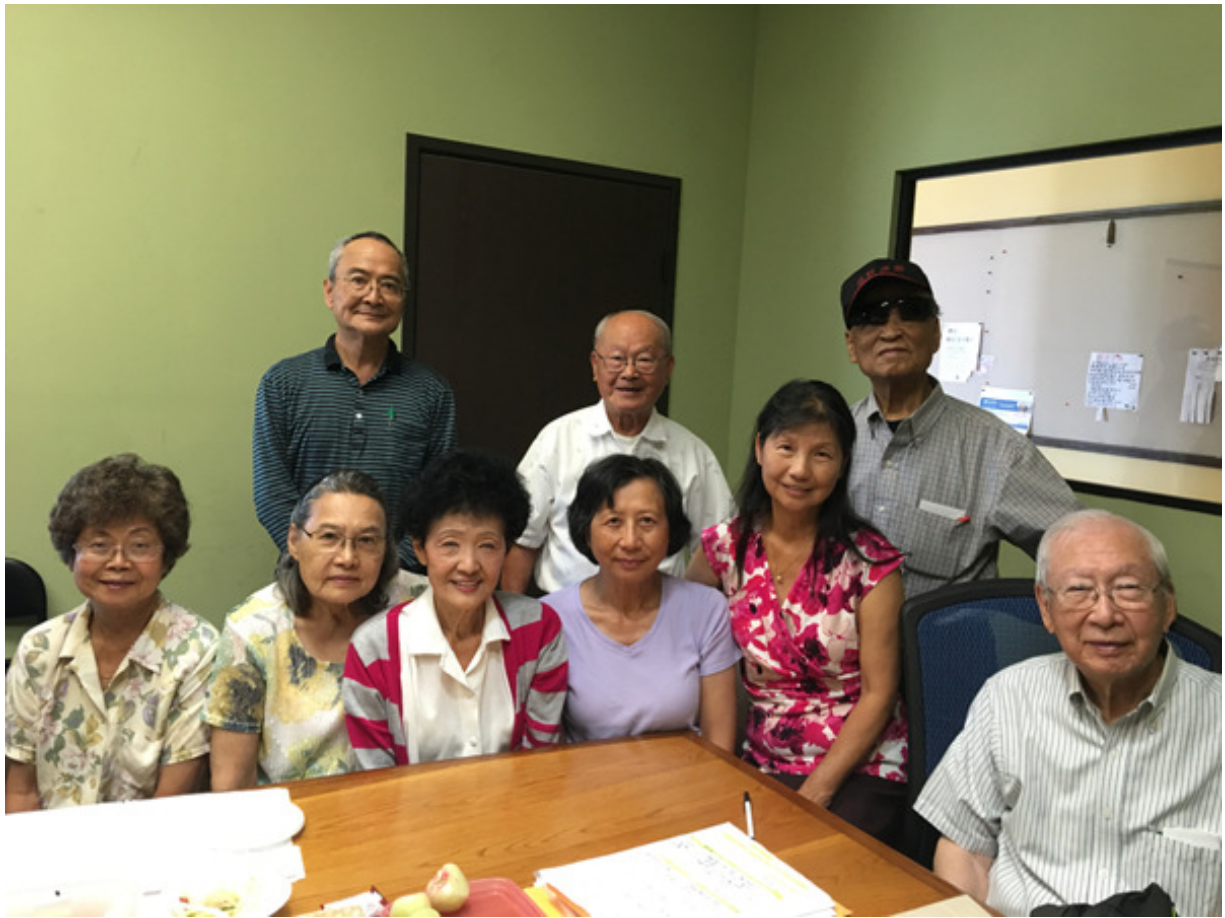
部分同鄉會理事與部分獎學金委員會委員合影