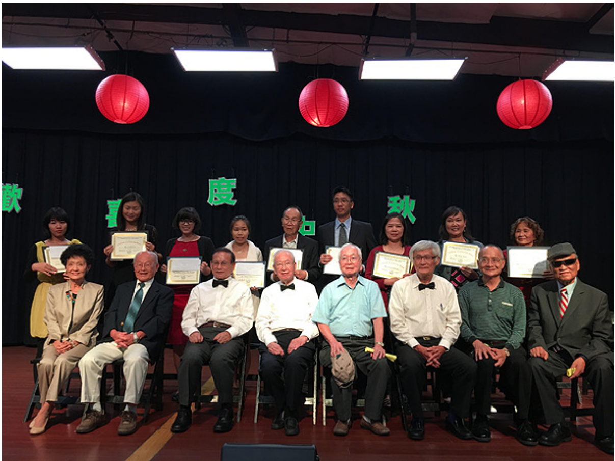
獎學金頒獎九位得獎者及七位評審委員的合照