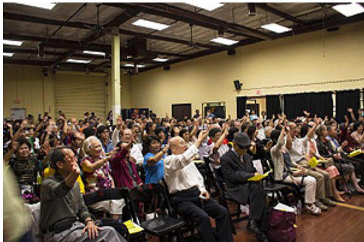
9月17日，聖地亞哥臺灣同鄉會在臺灣中心舉辦中秋慶祝晚會，現場氣氛熱鬧溫馨，臺上臺下互動熱烈。