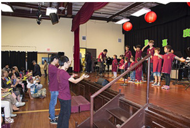
9月17日，聖地亞哥臺灣同鄉會在臺灣中心舉辦中秋慶祝晚會，三代同堂同臺表演、同堂觀看，現場氣氛熱鬧溫馨。圖為臺上、「臺中」、臺下，融為一體。(楊婕／大紀元)