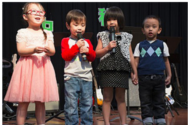
9月17日，聖地亞哥臺灣同鄉會在臺灣中心舉辦中秋慶祝晚會，三代同堂同臺表演、同堂觀看。圖為可愛的兒童用臺語朗誦詩詞。