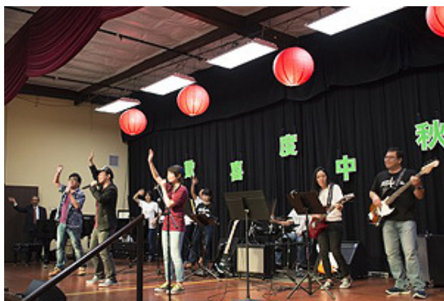
9月17日，聖地亞哥臺灣同鄉會在臺灣中心舉辦中秋慶祝晚會。圖為聖地雅歌臺灣基督長老教會的年輕人演唱歌曲，並和觀眾熱烈互動。