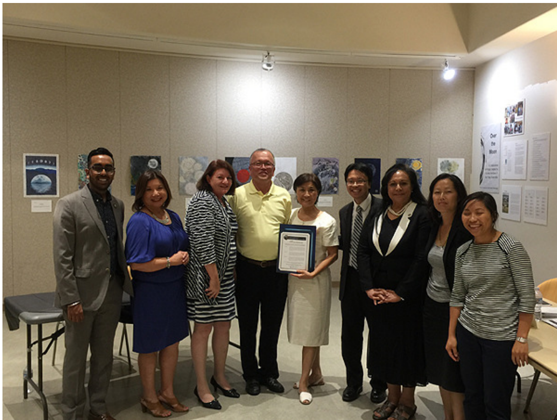
加州眾議院亞太事務委員會於9-26 頒發表揚狀給 TACC 及執行主任