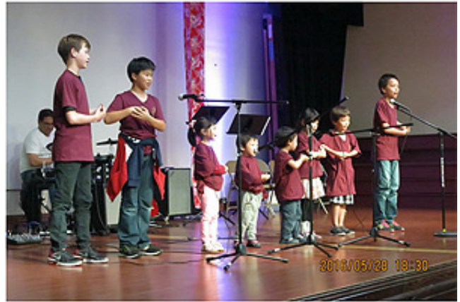
聖地牙哥台灣基督長老教會主日學小朋友兒歌組曲