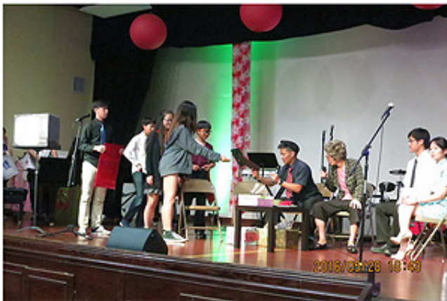
聖地牙哥台灣基督長老教會青少年團契短劇「阿公70歲生日」