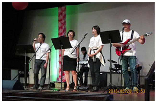
聖地牙哥台灣基督長老教會敬拜讚美團帶動唱