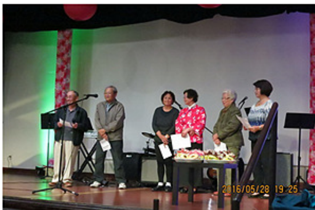
台灣中心台語班表演七言詩朗誦「邱罔舍新歌」