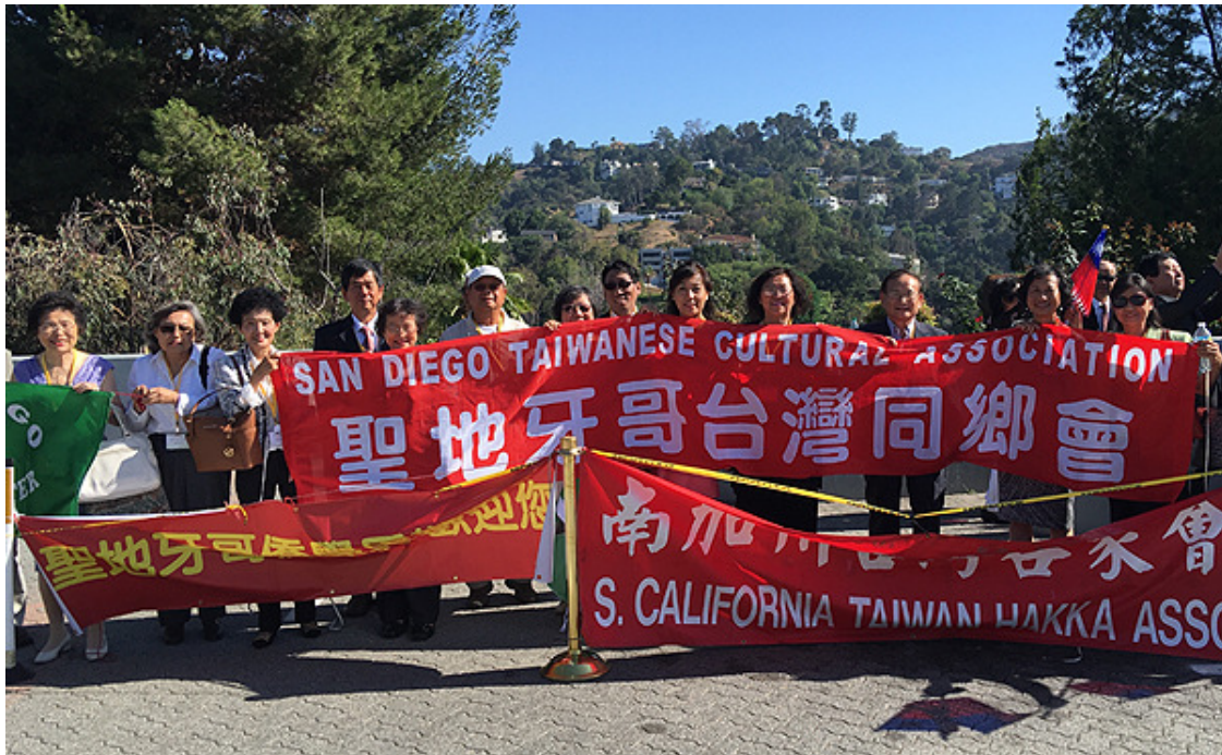
6/30/16 聖地牙哥台灣同鄉會歡迎蔡英文總統過境洛杉磯。