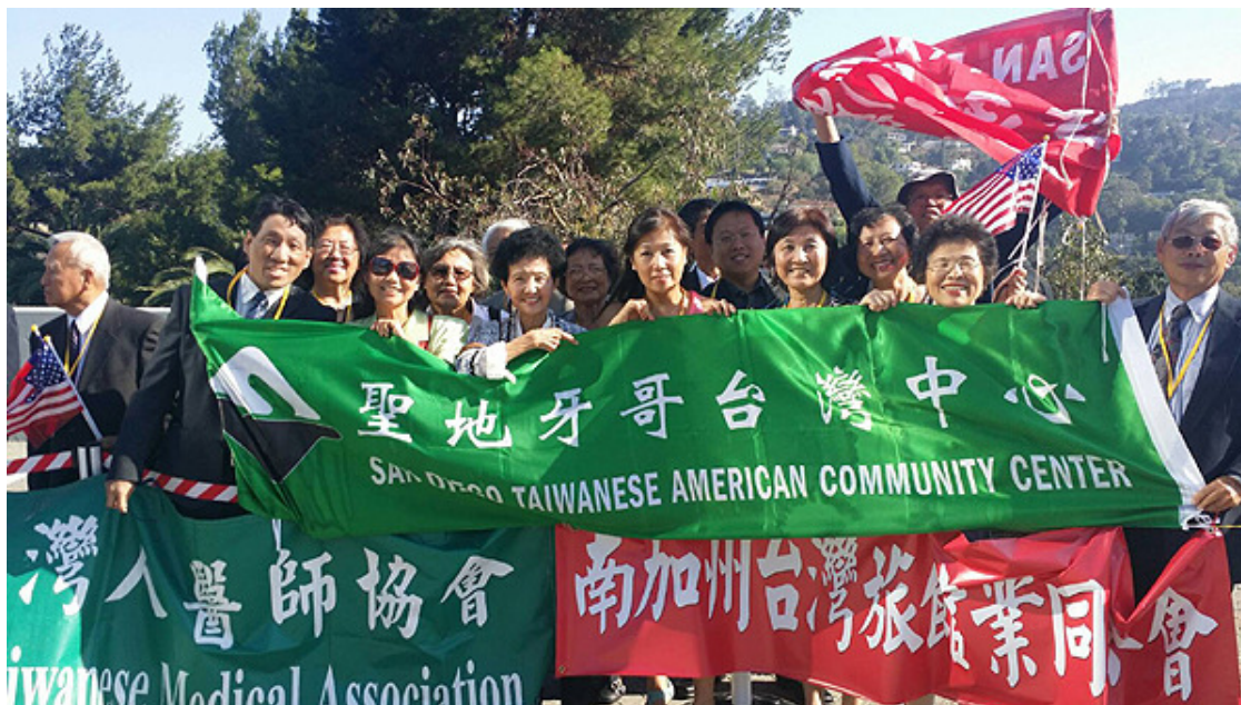
6/30/16 聖地牙哥台灣中心歡迎蔡英文總統過境洛杉磯。