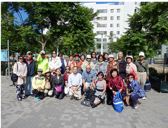
七月七日長輩組遊聖地牙哥港