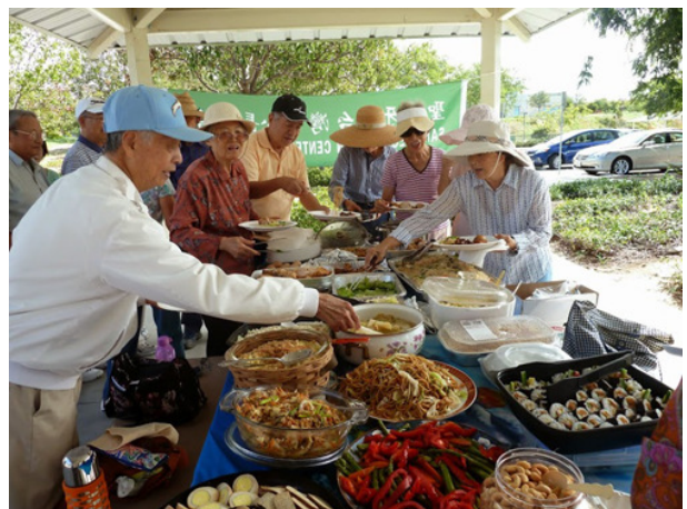
2014/10/15 台灣中心長輩組於Nobel Athletic Fields and Recreation Center 野餐