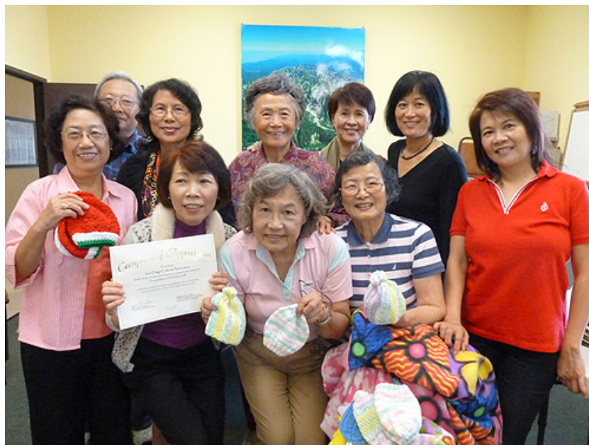
《台灣中心義工送暖活動》「禮品贈戰士」與「車毯子，送愛心」活動。