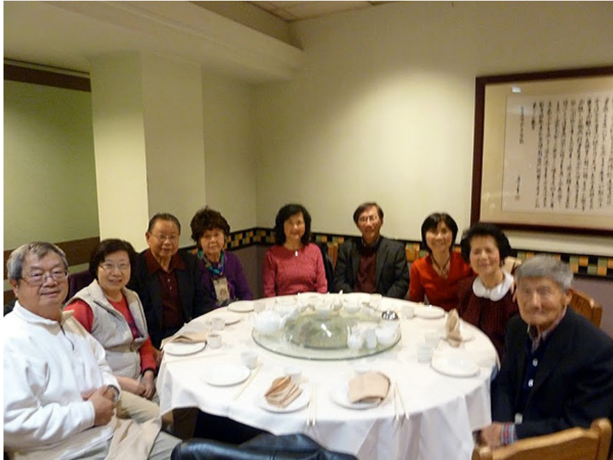
2013 台灣中心跨年晚會於餐廳聚餐