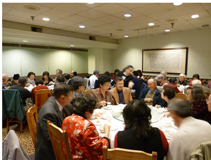
跨年晚會於福臨門餐廳聚餐

果、春捲等宵夜點心。大家觀看電視倒數新年來臨，舉杯歡呼新年快樂。合唱團帶唱跨年必唱的 Auld Lang Syne (long long ago, for old times' sake, 憶昔時，螢の光) 之後，盡興散場。