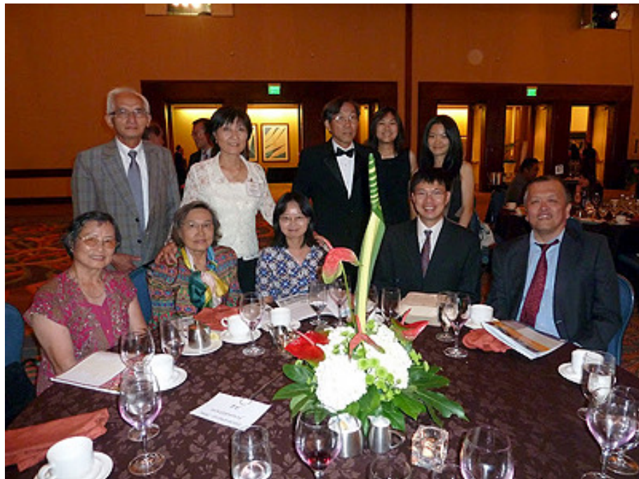
聖地牙哥台美基金會/台灣中心榮獲聖地牙哥亞太美傳統協會頒發的2012年社區服務大獎