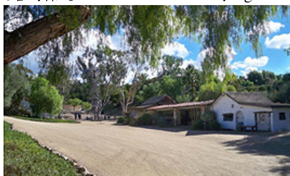
圖十：馬廄及工具間