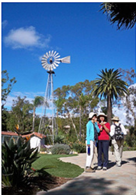
圖四：前院遠處的风車