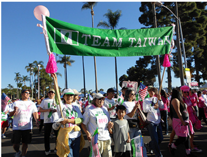
11/4/2012 Team Taiwan 參加 Susan Komen Race For the Cure