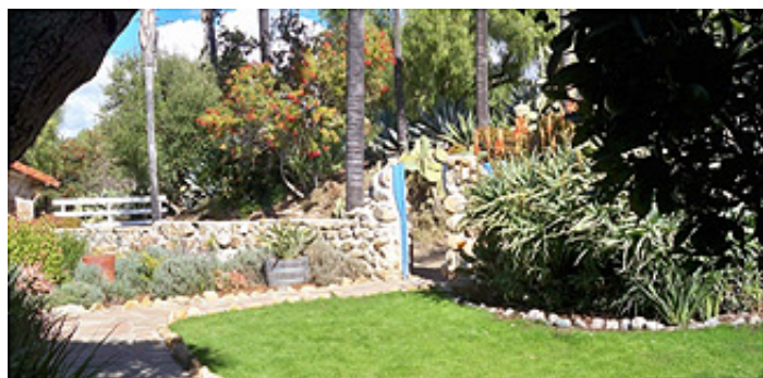
圖九：花木扶疏的後院庭園景觀