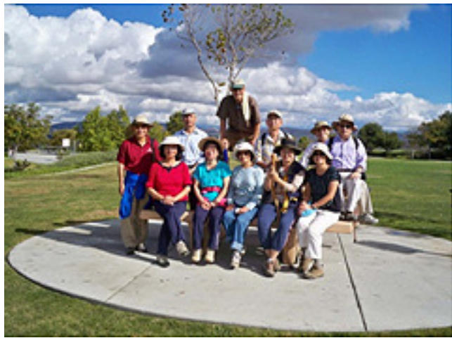
圖二：坐下來，陪領隊照一張