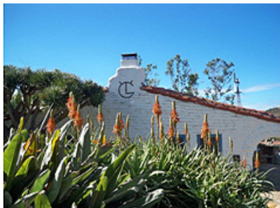
圖八：庭院一角，屋脊上刻著Leo Carrillo故居的標誌〔Leo Carrillo Ranch的logo〕