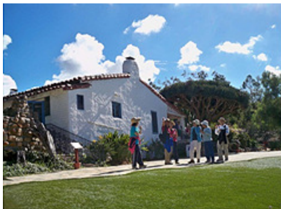
圖五：院子裏的草坪