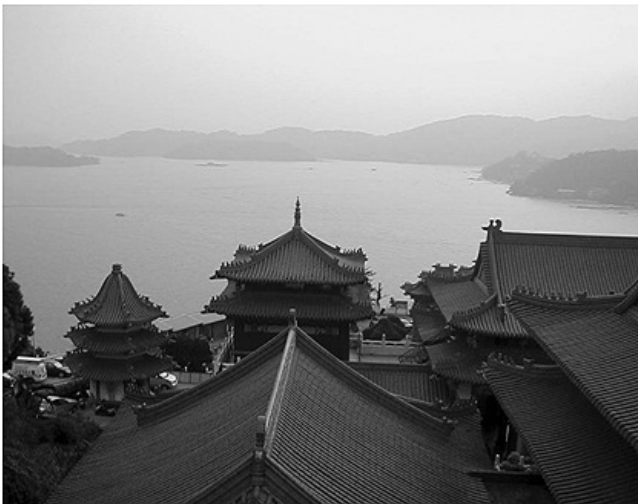
遠眺日月潭 / 作者：湯昇勇 拍於文武廟旁。文武廟於 1969 年重建，規模宏大、氣勢磅礴；廟分三殿