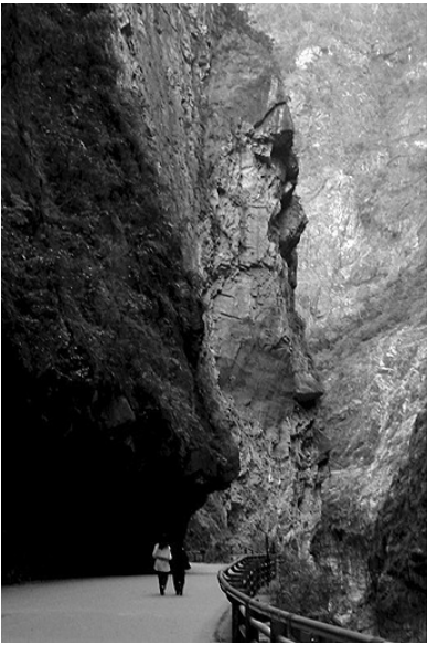
斷崖絕壁 / 作者：吳得民 攝於太魯閣國家公園。畫面包括了二個行人(其實是攝影者的牽手及姪女)以突現出山崖的雄偉。