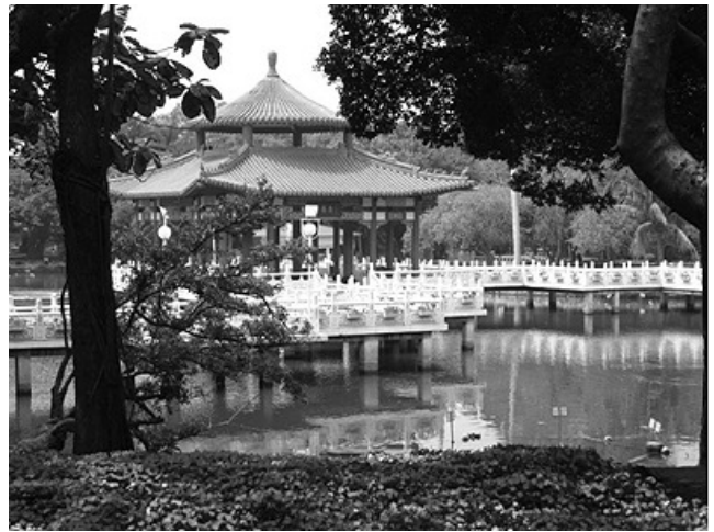
臺南公園 / 作者：莊輝美