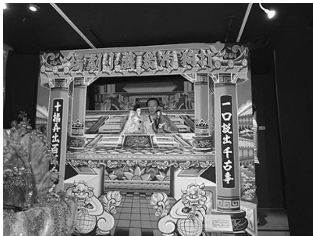
打狗布袋戲小劇場展示臺 / 拍於高雄 懷念古早的掌中戲 / 作者：陳德彥 對聯：一口說出千古事 十指弄出百萬兵 您認得圖中布袋戲師傅嗎？