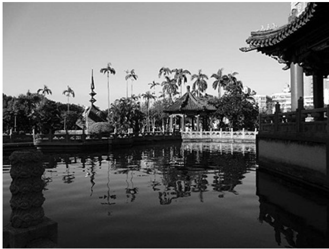
二二八和平公園 / 作者：洪純仁