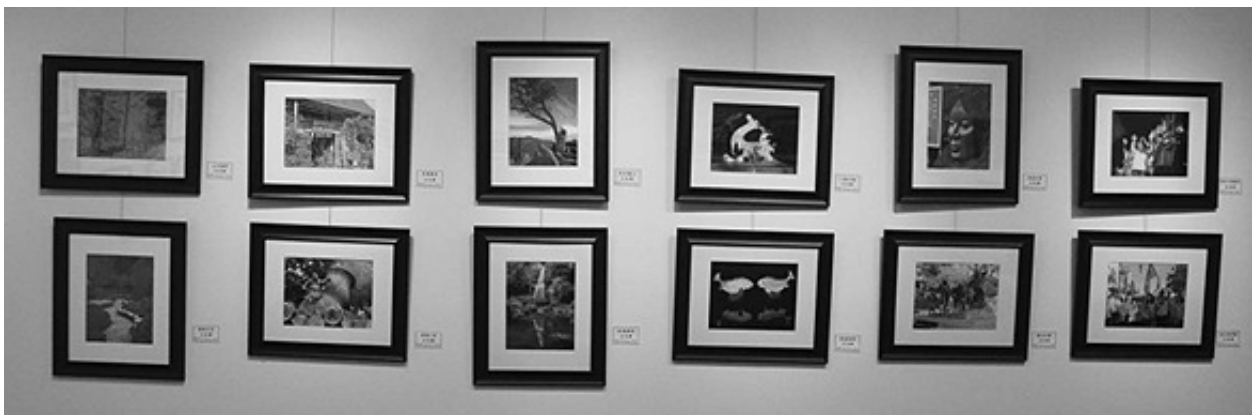
2012年臺灣傳統週臺灣人文風情攝影展展覽室一角

展覽者的名字附在下面他們的代表作旁邊，這裏不另重複。展覽內容以臺灣風景約佔半數，另半數則包羅萬象，如廟會、小吃、及各種民俗等，讓展覽生色不少。若還沒有來參觀過這個攝影展的同鄉們，請撥空前來參觀，相信不會讓你失望。有些作品作者甚至願意割愛，義賣所得將悉數捐給臺灣中心。展覽地點在臺灣中心的畫廊，時間從5月12日開始，8月底結束。下面附有每位參加展覽者的代表作，讓各位欣賞。可惜這印刷品是黑白的，比不上彩色的實際作品。個人作品編排次序以收稿次序為準。