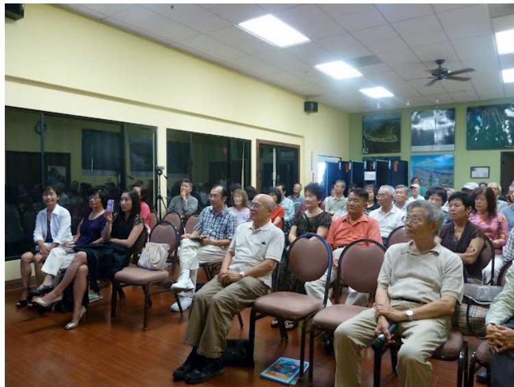
7/14/2012 生活座談會「我的第一次」