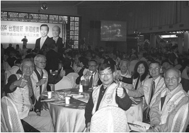
2008 年臺灣總統選舉 / 作者：劉信達 這是北美洲台灣人教授協會參加 2008 年臺灣總統選舉臺灣科技界長昌 [謝長廷、蘇貞昌] 後援會成立大會