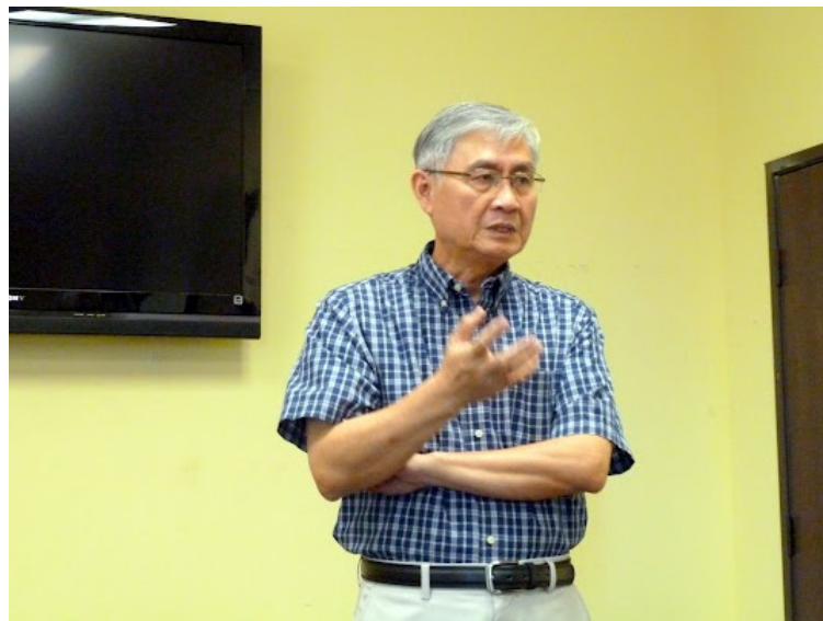
7/1/2012 讀書會「彌蘭陀王之辯」 by 楊宗翰