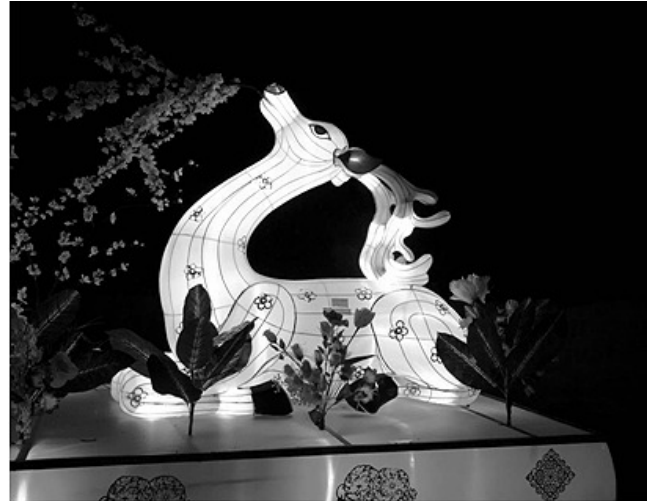
小鹿花燈 / 作者：王克雄 拍於杉林溪渡假園區 台灣的花燈實在精緻