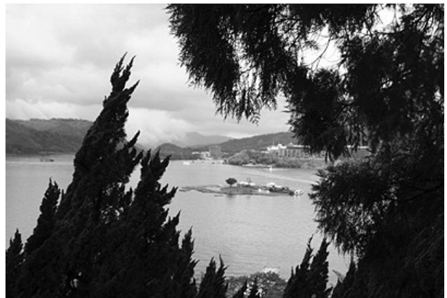
日月潭 / 作者：黃獻麟