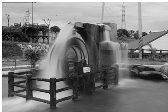
水車 / 作者：林坤鎮 位於臺東市，卑南溪起水口