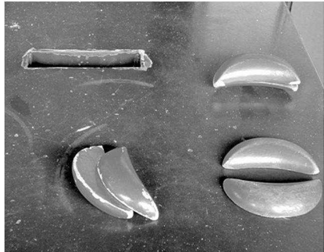
奉獻箱上的神筊 / 作者：曾惠貞 2012 年四月攝於台北保安宮，聖筊是民間信仰的一種尋求神明指示的工具。